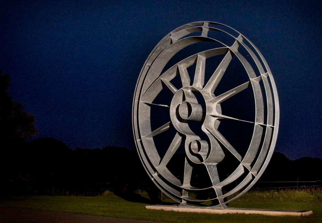
"Het Wiel" in de nacht