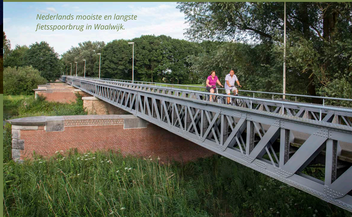
Nederlands mooiste en langste fietsspoorbrug in Waalwijk.

Wij hopen dat 2021 een jaar van nieuwe inzichten wordt.